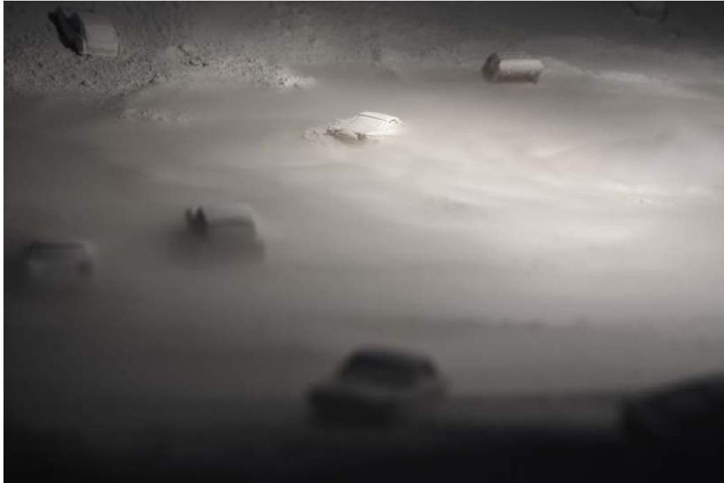
Sans Titre 1 / 2011 / photo de "La Palette" / 150cmX100cm