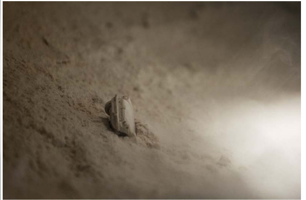
Sans Titre 4 / 2011 / photo de "La Palette" / 90cmX60cm