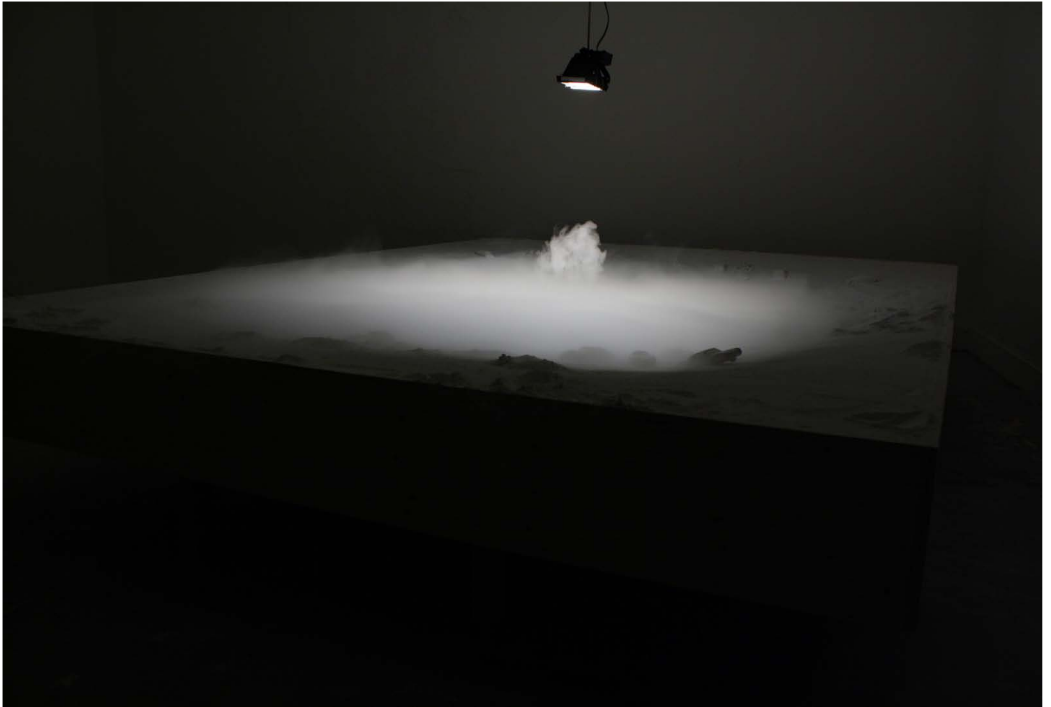
La Palette / 2009 / Installation / moulage, poudre de plâtre, vapeur de l'eau / 263cmX193cm