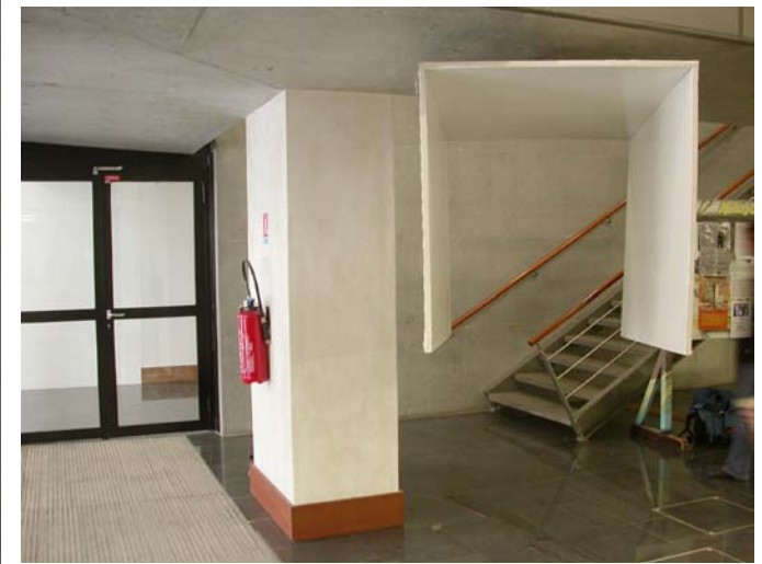
A Travers des Toiles3 / 2007 / Installation / les toiles, gesso, verni acrilique / 190cmX135cmX130cm