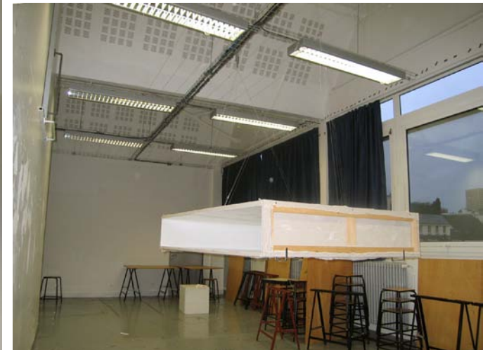
A Travers des Toiles2 / 2006 / Installation / les toiles, gesso, verni acrilique / 190cmX130cmX35cm