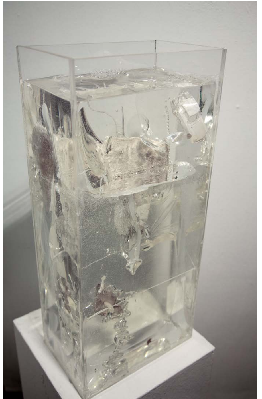
Les Pièces Qui Restent 1 / 2010 / Sculpture / moulage, résine, plâtre / 25cmX15cmX55cm