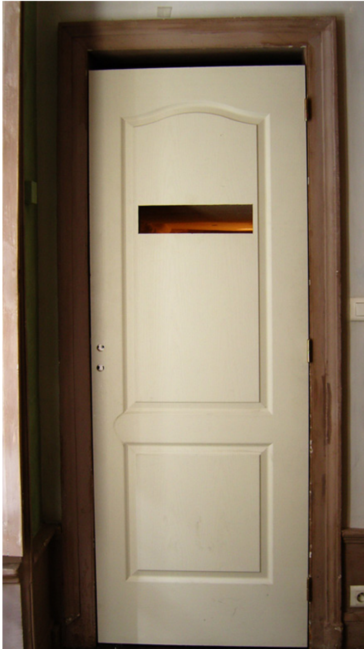
"Vue par le trou de la porte"