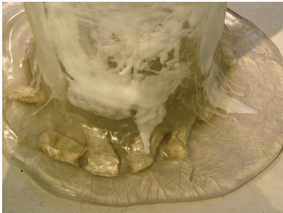
Bulle d'Air / 2008 / Moulage / polyuréthane, plâtre / 120cmX75cmX75cm