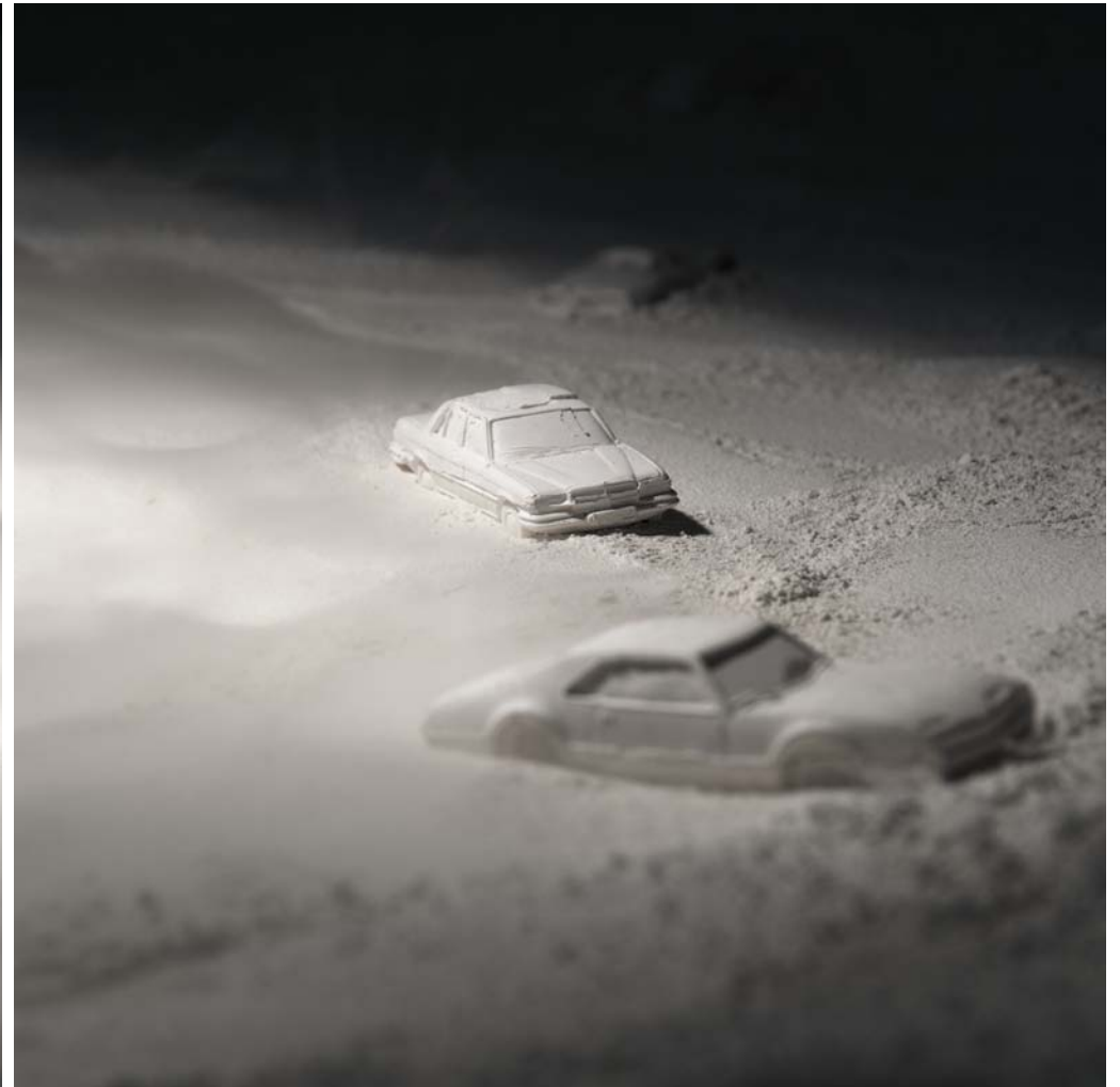
Sans Titre 2 / 2011 / photo de "La Palette" / 60cmX60cm