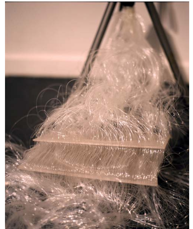
Flux de L'Image / 2005 / Installation / fil de nylon, trépied, plaque de plexiglas / 250cm