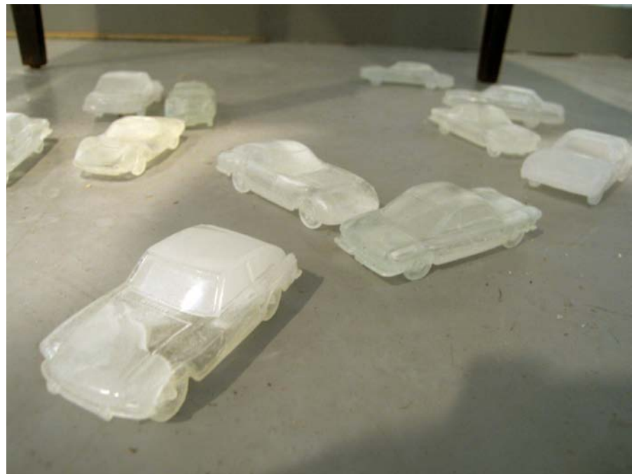
Les Instants / 2008 / Installation, Moulage / polyuréthane, plâtre / 85cmX70cmX52cm