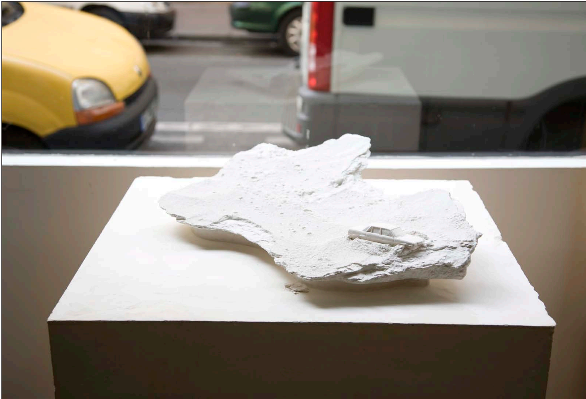
Une Des Pièces Restées 2 / 2009 / Sculpture / plâtre / 74,5cmX66cmX30cm