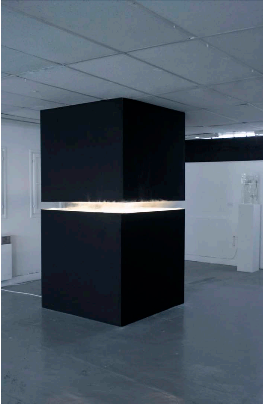
Experience De Matérialisation De La Mémoire / 2010 / Installation / poudre de plâtre, vapeur de l'eau / 125cmX125cmX280cm