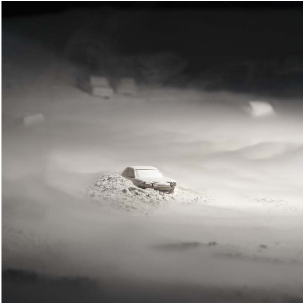
Sans Titre 3 / 2011 / photo de "La Palette" / 60cmX60cm