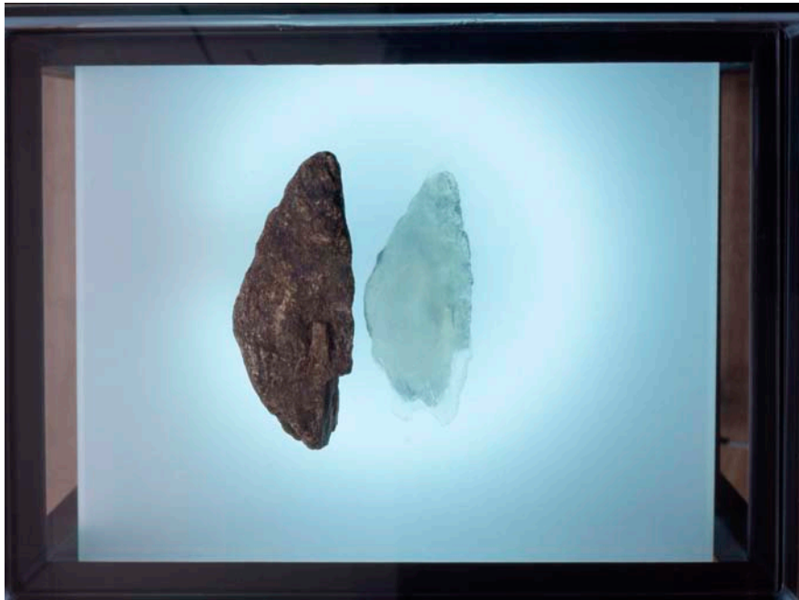
"La pierre" vue en dessus