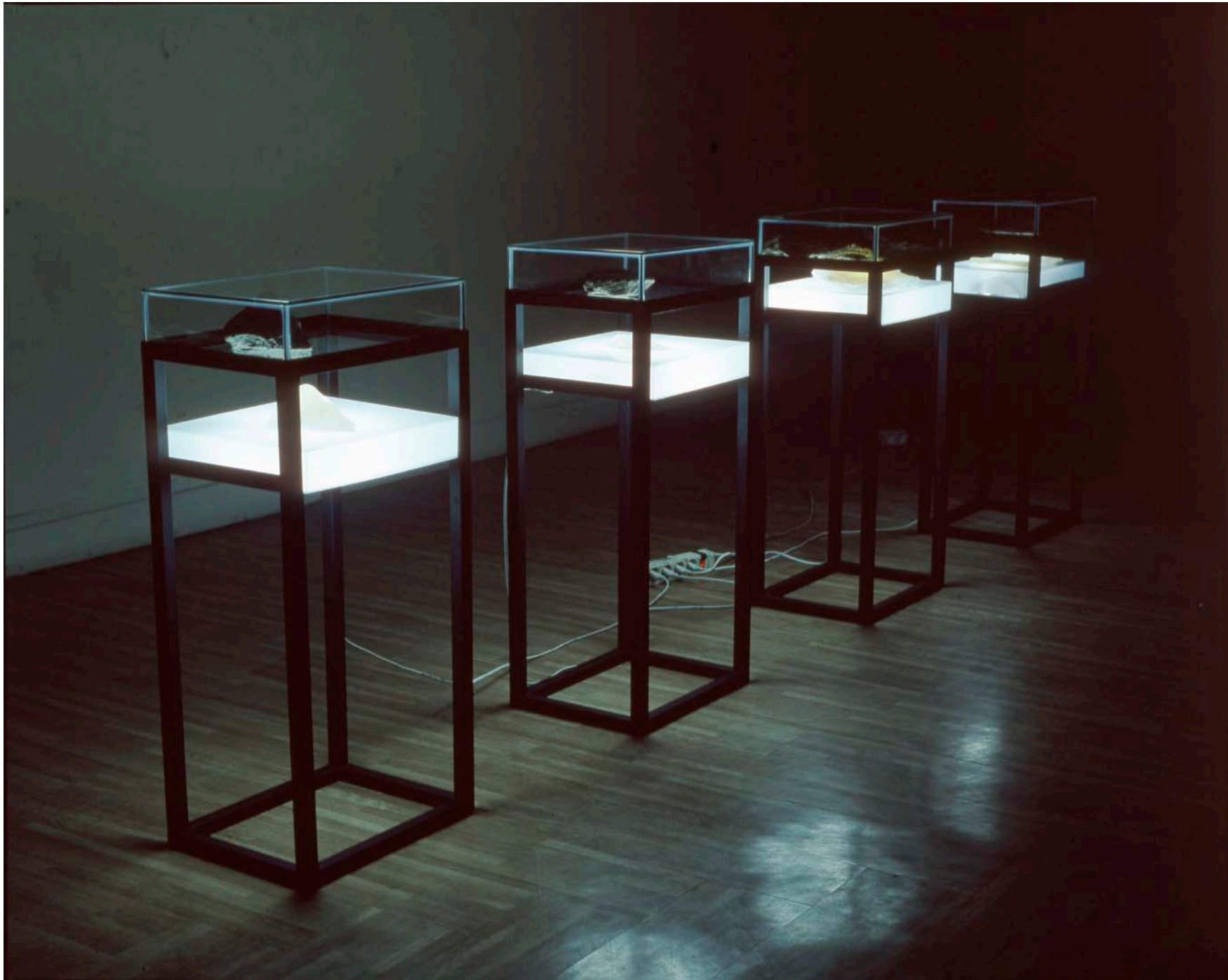
La Pierre / 2000 / Installation, Moulage / silicone, pierre / 40cmX30cmX80cm