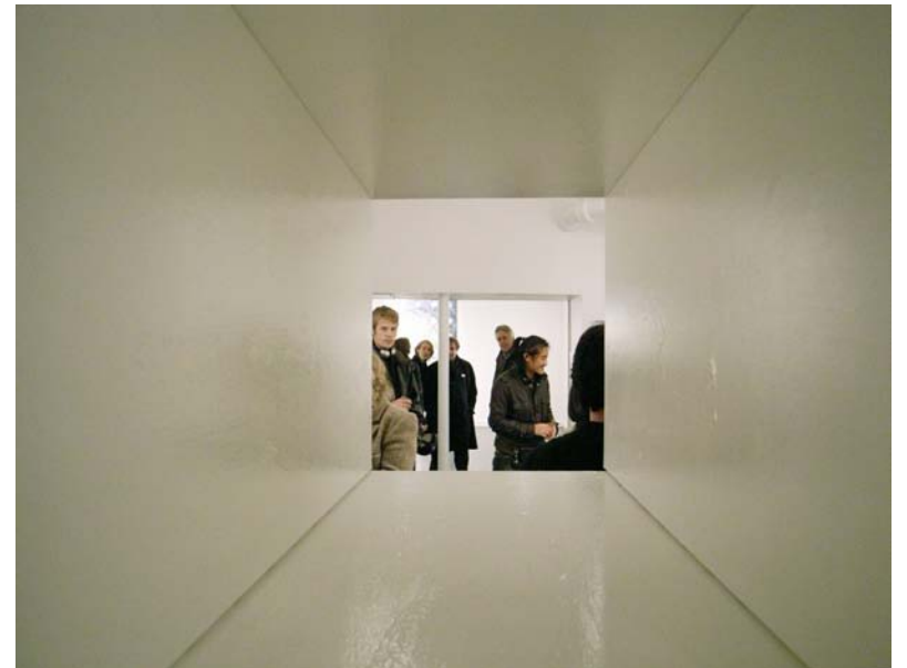
A Travers des Toiles1 / 2006 / Installation / les toiles, gesso, verni acrilique / 30cmX35cmX55cm