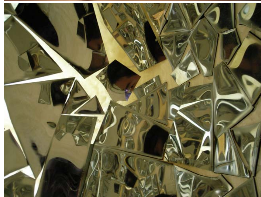
De Dans De Hors / 2006 / Installation, Moulage / polyuréthane, fil de nylon, miroir / 120øX55cm